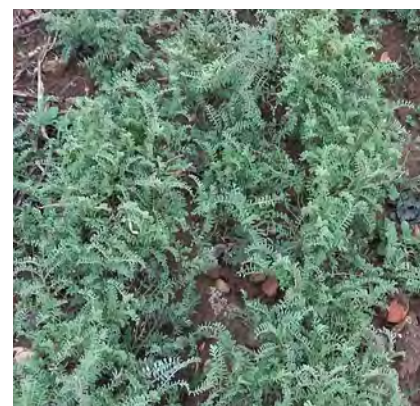
Développement au 14/12/17 Semis début septembre 2017

Elle ne supporte pas les passages et donc ne peut être valorisée en inter-rang en vigne ou lavande. A réserver aux intercultures sur sol séchant, caillouteux ou en pente (utilisée sur le plateau de Valensole) si les semences sont disponibles. Essais à poursuivre pour affiner ses potentialités.