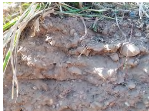
Chambre d'agriculture de la Drôme