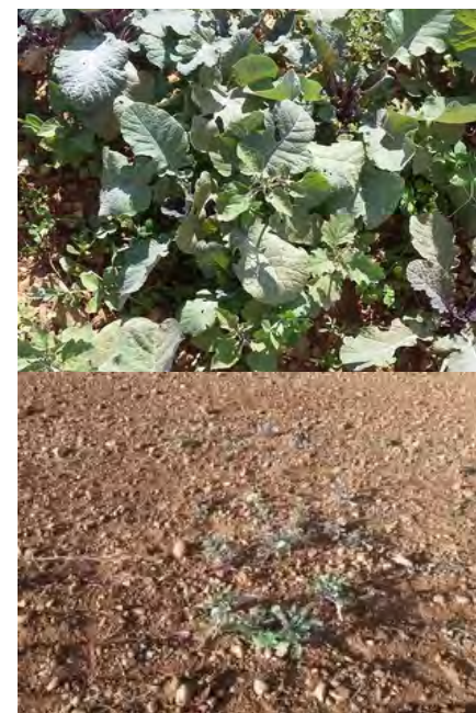
Moutarde d'Abyssinie non détruite par le déchaumage avant plantation du méteil - Constat au 14/12/17