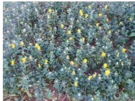
Semis du 25/07/2017 Premières fleurs début octobre

A noter : l'utilisation par un agriculteur pour repousser les sangliers.