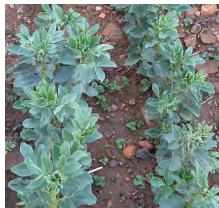
Féverole implantée en septembre - développement au 14/12/17

D'où la question : et si on laissait faire à condition les levées des adventices en début d'été ? A condition de le broyer ou le faucher avant toute grenaison.