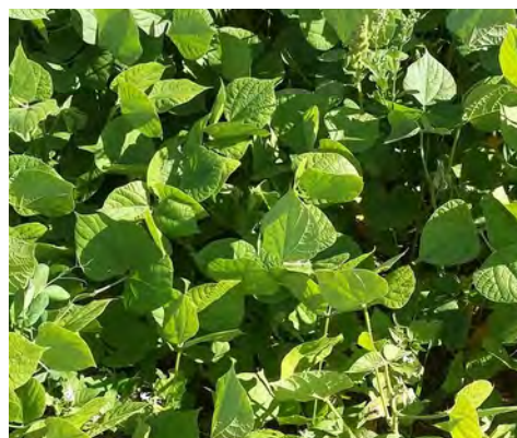
Semis du 25/07/2017

Le coût des semences en fait, pour l'instant, une plante plus destinée à une culture fourragère qu'à un couvert (= « soja des zones sèches »).