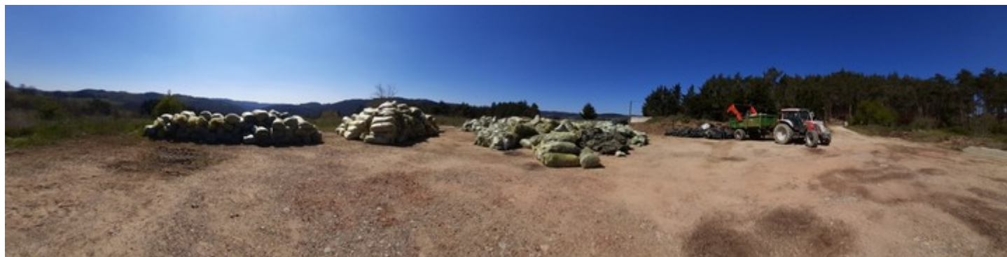
Site de Vernoux

➤ 142 tonnes de déchets plastiques collectés dont 101 tonnes seront recyclés en matière plastique (soit 81 tonnes équivalent pétrole). La quantité collectée est logiquement inférieure à 2020 (-20 %) puisque moins d'un an s'est écoulé entre la collecte 2020 qui a eu lieu en septembre et celle de 2021 qui a été recalée en avril (8 mois de production de déchets au lieu de 12).